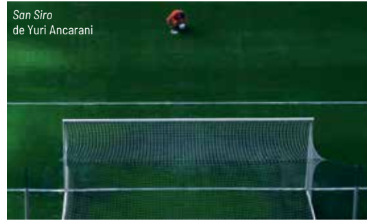
San Siro de Yuri Ancarani

V I D É O / / L E S B E A U X J O U R S MAISON DE L / I M A G E