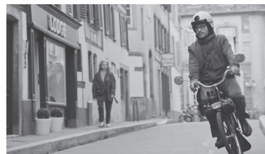
Tous les soleils Philippe Claudel