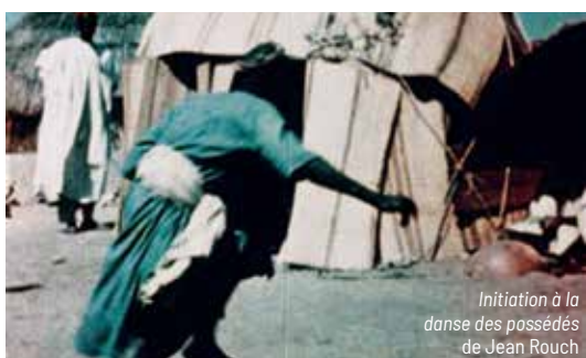
Initiation à la danse des possédés de Jean Rouch