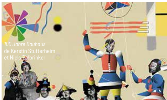
100 Jahre Bauhaus de Kerstin Stutterheim et Niels Bolbrinker