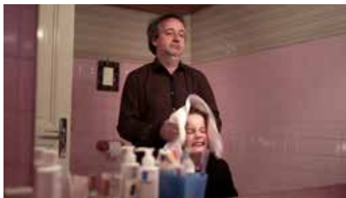
Poussin de Paul Lacoste

Avec la contribution active du CNC, de la Région et de l'Eurométropole, la création audiovisuelle prospère à travers les initiatives portées par les acteurs régionaux, tels que les auteurs et les sociétés de production. Le Mois du film documentaire permet de faire vivre les productions et le patrimoine cinématographique en les faisant circuler dans la lumière des lieux de projections.