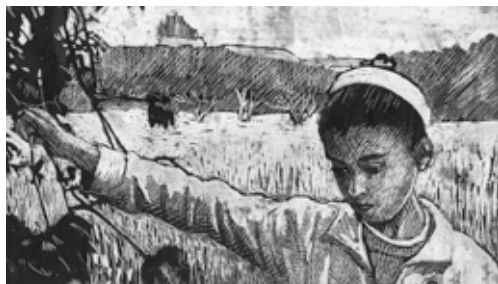
Samouni road Stefano Savona